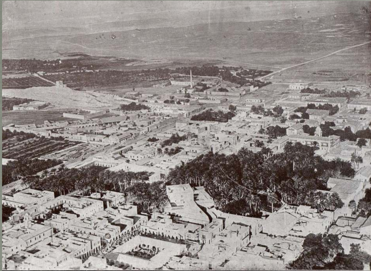
Vue générale de Biskra.